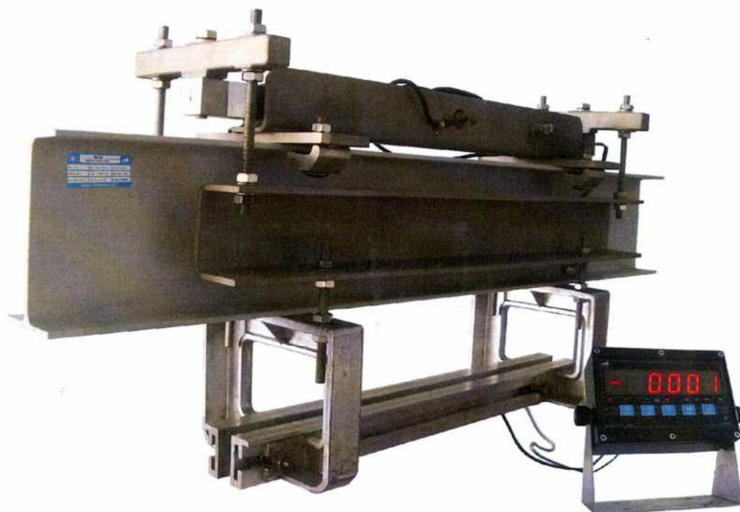
Рисунок 2 – Вид модификации M8700-2

Ограничение доступа к узлам регулирования, влияющим на метрологические характеристики весов, осуществляется защитной пломбой, с нанесенным знаком поверки, размещенной на терминале, как показано на рисунке 3.